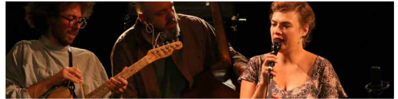
Moriarty - 1 octobre 2015

www.watusi-music.com www.youtube.com/channel/UCHagEI_40cvN_45pF60Kocw