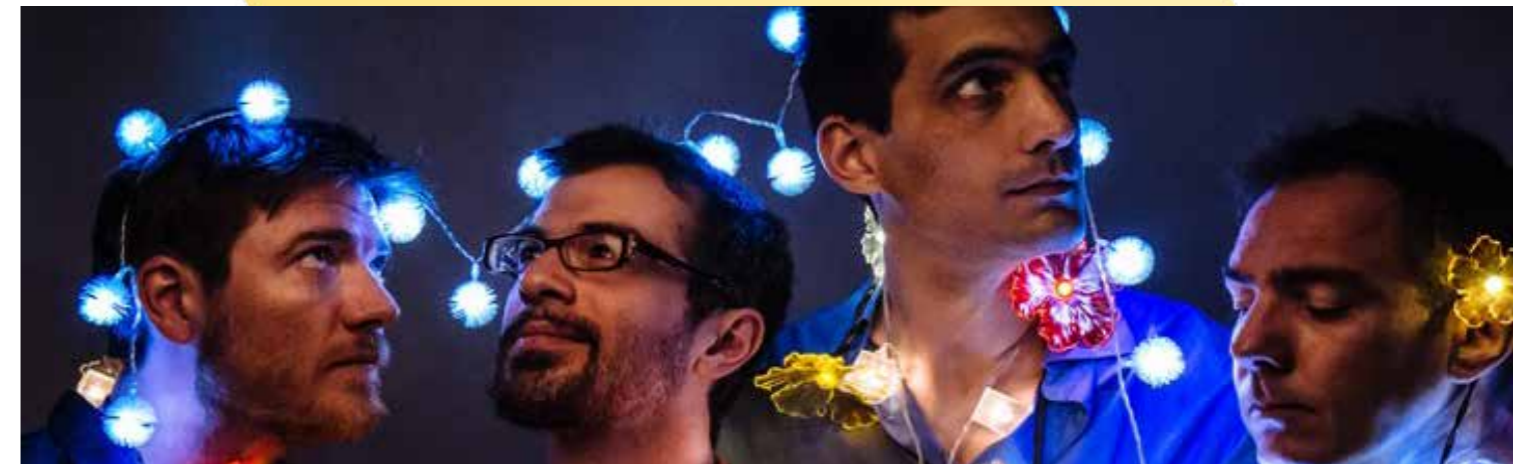
Pulcinella - du 10 au 14 octobre