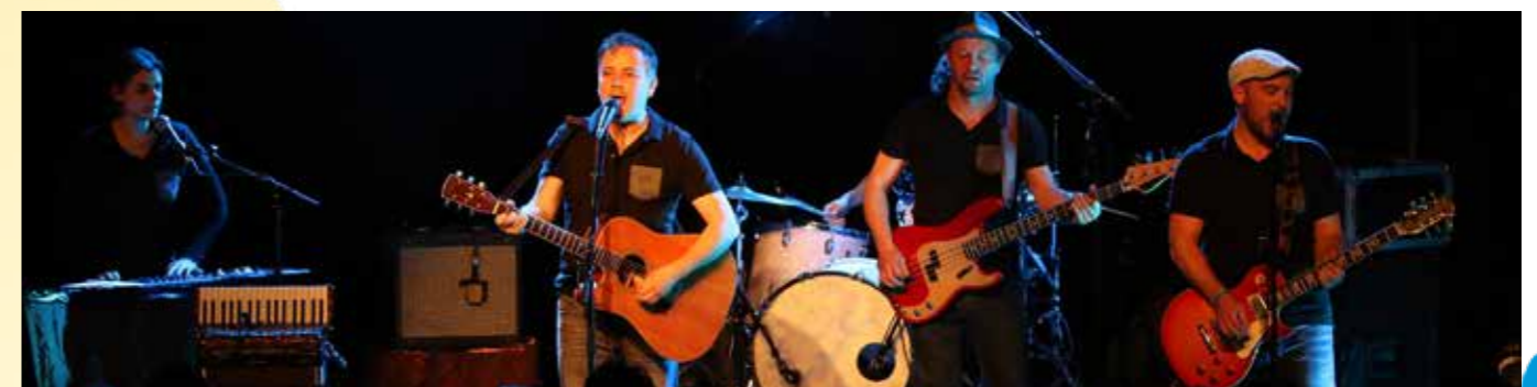
Mickey 3d - 05 juin 2016