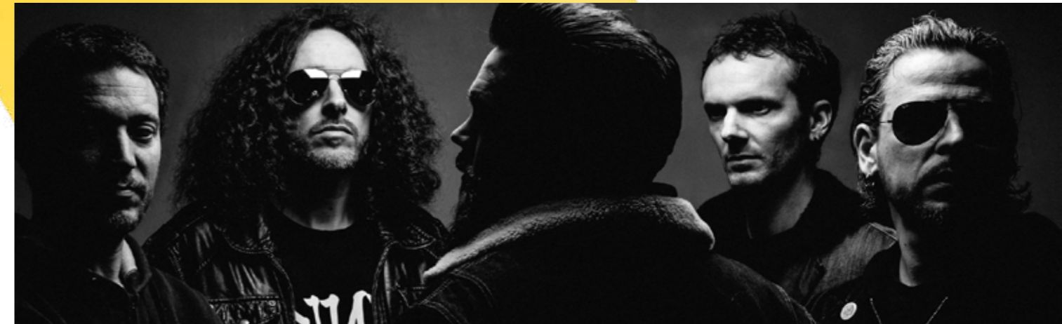
Sidilarsen - du 4 au 6 octobre