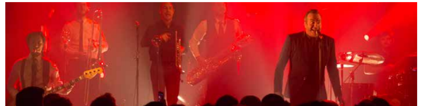
Electro Deluxe - 13 février 2016