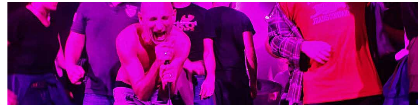
No one is Innocent - 06 novembre 2015