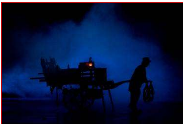
La charrette, comme fil conducteur, reste présente dans chaque opus

Ainsi en trois actes seront évoqués trois générations, trois étapes, trois histoires, trois rencontres, trois issues, trois nouveaux départs.